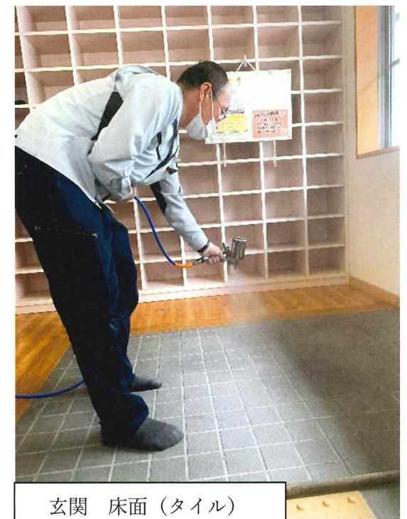
玄関 床面 (タイル)